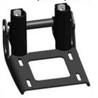
29 Support repose pieds