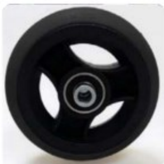
18 Roulettes pneu plein