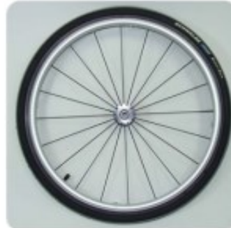
11 Roue Hoggi Light