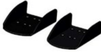
34 Repose pieds