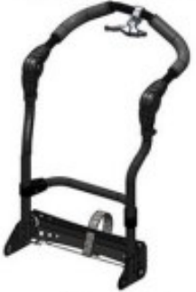
05 Barre de poussée inclinable + rabattable (type poussette)