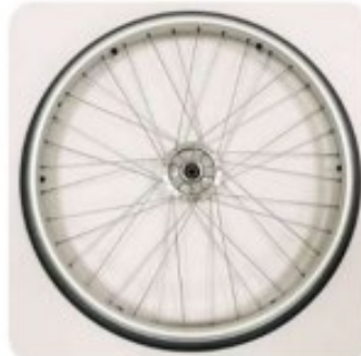
10 Roue std FT main courante alu + pneu plein