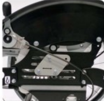
06 Sécurité de transport