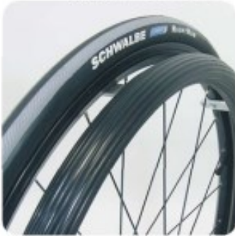
37 Protection main courante