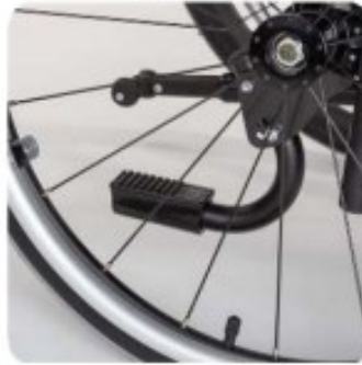
39 Aide bascule