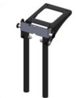
27 Angle genou 90°