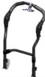
03 Barre de poussée rabattable (type poussette)