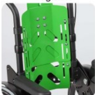
25 Dossier anatomique réglable