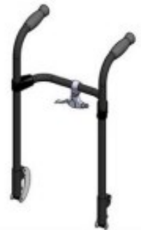
04 Poignées rabattables (type fauteuil)