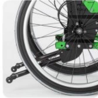
38 Anti bascule