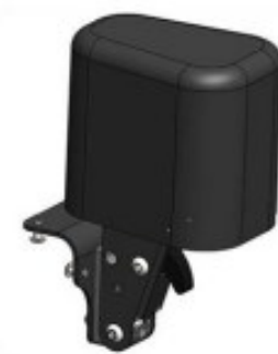
23 Plot d'abduction