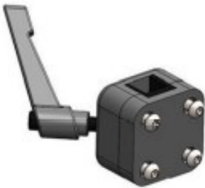
41 Support repose tête