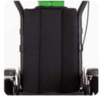
36 Coussin dossier