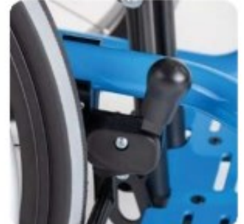
08 Freins genou sur châssis