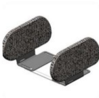
22 Cales cuisses réglables