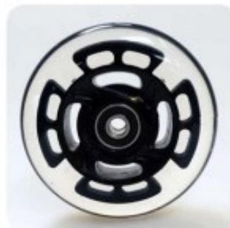
19 Roulettes skate