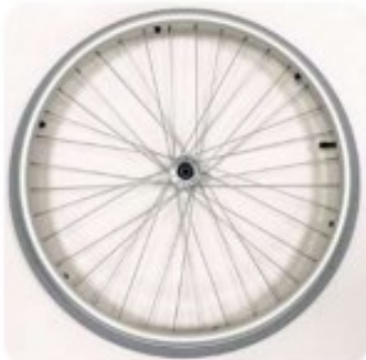
09 Roue std main courante alu + pneu gonflable