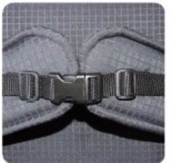
44 Ceinture thorax