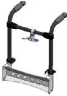
02 Poignées démontables (type fauteuil)