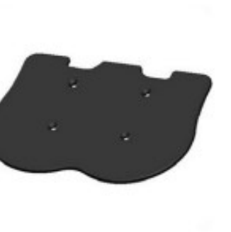
31 Repose pieds