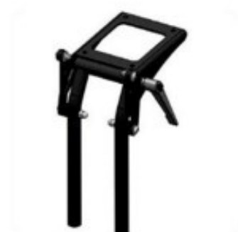
28 Angle genou 85°-160°