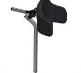
42 Repose tête support nuque