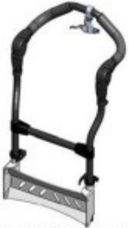
01 Barre de poussée démontable (type poussette)