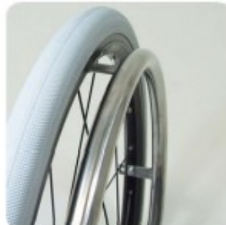
15 Main courante inox standard