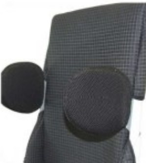
43 Cale thorax