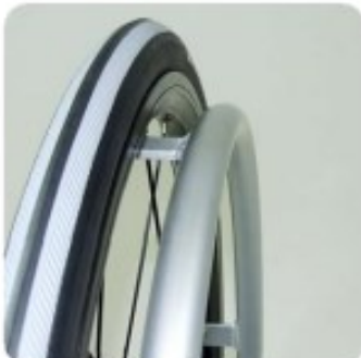
13 Main courante alu standard