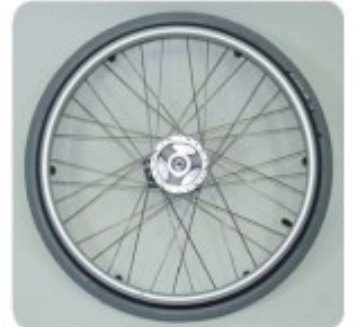
12 Roue FT Hoggi Light