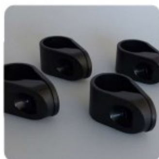
26 4 fixations D25