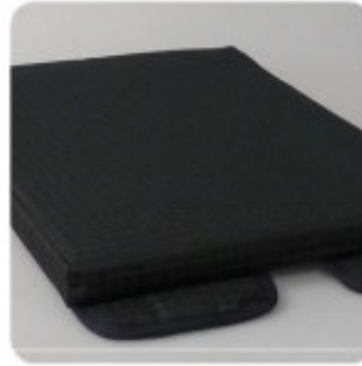
35 Coussin d'assise