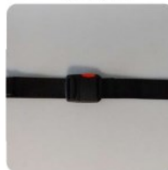
47 Ceinture ventrale