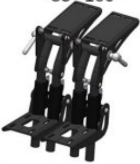
33 Angle genou (réglage individuel) 85°-160°