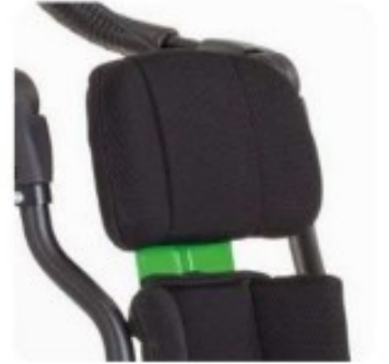
40 Repose tête std mousse