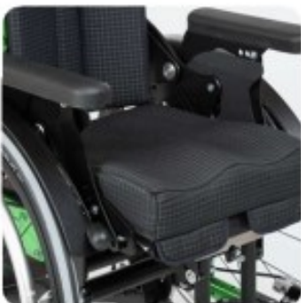
45 Accoudoirs inclinasion variable