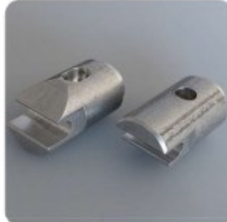
07 Renfort poignée / barre de poussée