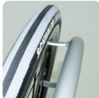
14 Main courante alu haut