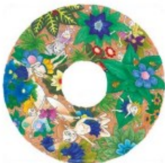
17 Flasques motif