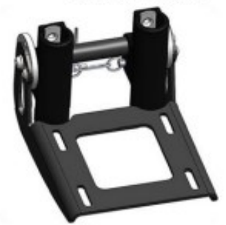
30 Support verrouillable